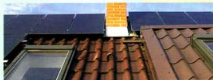
Az Amorf szilícium napelemek sokkal több energiát termelnek Napelemes családi ház - Magyarország, 2002

Ez a megoldás azonban sajnos csak a kisebbik rossz választása. A probléma ezzel egyáltalán nincs megoldva, hiszen a Föld lakossága egyre szaporodik és energia igényeink is egyre nőnek. Minden felelősen gondolkodó embernek, nép-csoportnak, kormánynak, szervezetnek felelőssége és kötelessége kiállni, olyan energia termelő módszerek felkutatása, alkalmazása és bevezetésének támogatása mellett, amely megoldást jelenthet a növekvő energia gondokra, és környezetvédelmi szempontból veszélytelen, önmagát megújító ciklussal rendelkezik.