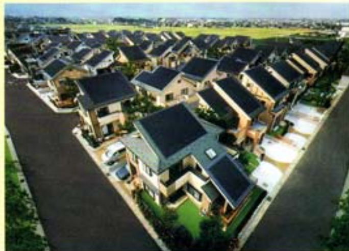
2003, Japán, solar falu - a napelem már státusszimbólum

tozza a termelést - vagy szélső esetben megszünteti (ha teheti!). Ahol ezt megtehetik, napjainkban nem igen építenek újabb „korszerűbb” atomerőműveket”.