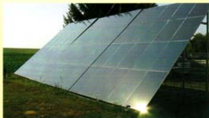
Napelemes magán villamos erőmű, Magyarország

Mindenkinek joga van az élethez a fejlődéshez, de ma már egyáltalán nem mindegy, hogy ez, az egyébként kívánatos fejlődés, milyen formájú és szerkezetű energia termeléssel valósul meg.