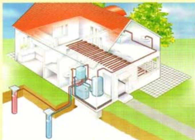
A hőszivattyú működési vázlatja

Beletartozik ebbe a végtelen óceáni élőhely mikroorganizmusai, vagy a földfelszínhez közeli vagy alatti élőlény struktúrák. Ezeket a ciklusokat ma még kevéssé ismerjük, de egyre inkább rá kell döbbsenni alapvető, korábban rejtett közvetlenül nem látható összefüggésekre melyek sokkal nagyobb hatásúak mint hittük. Alapvető fontosságúak. Ha ezek -a számunkra láthatatlan, látszólag közömbös - élet ciklusok elpusztulnak, ez további jelentős hatásokat generál. A légszennyezés ( savas esők, erdőpusztulás, mikroflóra pusztulás, vizek és édes vizek szennyeződése... stb) éppen ezeket a ma még kevéssé ismert ciklusokat teszik tönkre és így hatásuk visszafordíthatatlan.